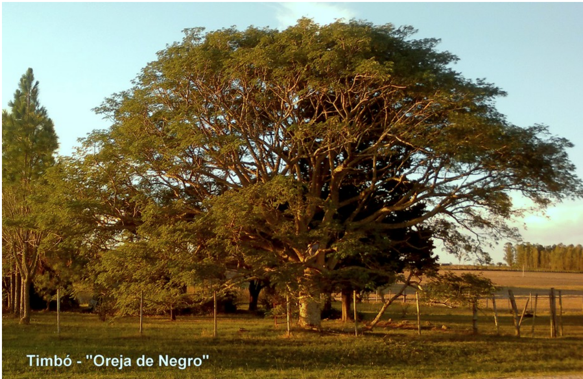
El Timbó – “Oreja de negro” - y su leyenda

Escrito por Daniel Bentancor Domingo, 26 de Marzo de 2017 23:06