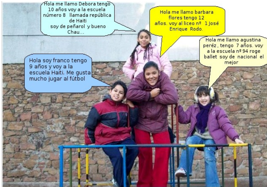
Plaza alfredo zitarrosa